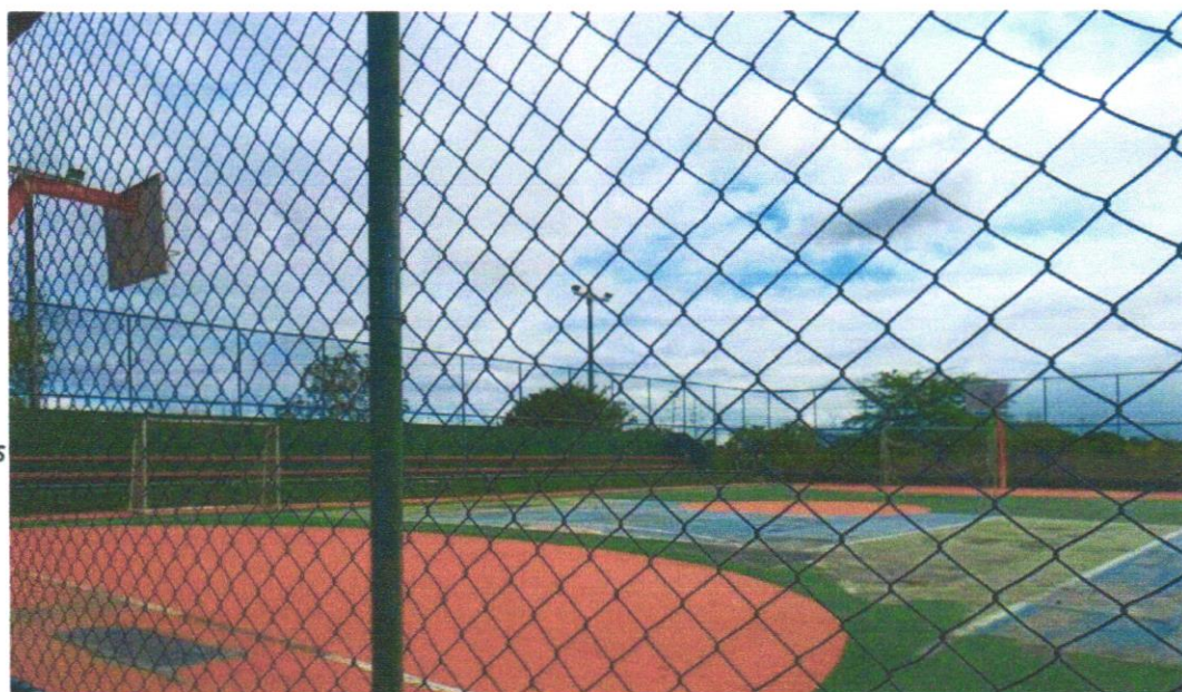
Foto 06 - Traves oficial para futebol de salão 3x2m em aço galv.3", com requadro e redes de polietileno fio 4mm (conjunto p/futsal)