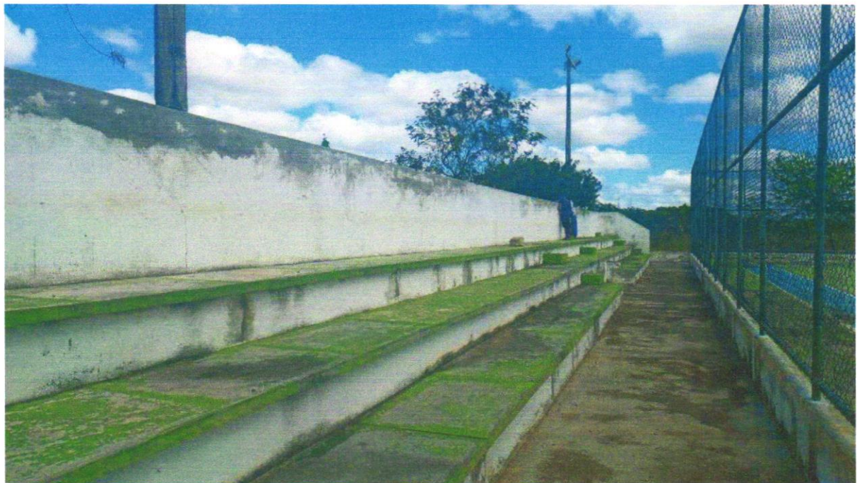
Foto 01 - LIMPEZA MANUAL