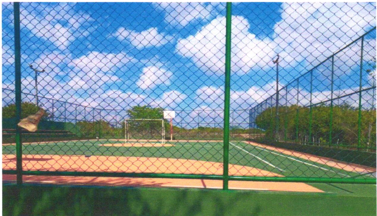
Foto 04- ALAMBRADO PARA QUADRA POLIESPORTIVA, ESTRUTURADO POR TUBOS DE AÇO GALVANIZADO, (MONTANTES COM DIÂMETRO 2", TRAVESSAS E ESCORAS COM DIÂMETRO 1 ¼), COM TELA DE ARAME GALVANIZADO, FIO 10 BWG E MALHA QUADRADA 5X5CM (EXCETO MURETA). AF_03/2021